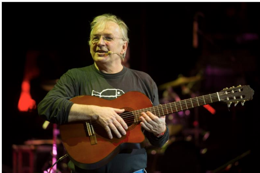
El cantautor argentino Luis Pescetti.

La presentación de “Insectos y Bicharracos” y el concierto de Luis Pescetti forman parte de la serie Miami-Dade County Auditorium Away from Home, un programa que consiste en presentaciones fuera del sitio en lugares alternativos con colaboradores comunitarios de FUNDarte, garantizando así que la magia de las artes escénicas continúe cautivando al público mientras MDCA esté cerrado temporalmente por renovaciones.