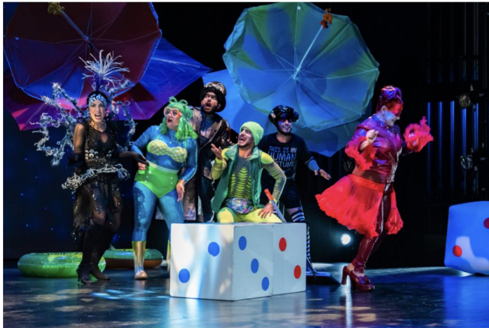
La obra "Insectos y Bicharracos" regresa al festival este año, por demanda popular.

La novena edición del esperado ZunZún Children`s Fest , uno de los múltiples proyectos de la prestigiosa organización multidisciplinaria FUNDarte , ofrecerá este año dos atractivos espectáculos para los más pequeños de la casa y para toda la familia, en dos sedes culturales miamenses: Westchester Cultural Arts Center el sábado 12 de octubre; y Miami Beach Bandshell el domingo 13 de octubre.