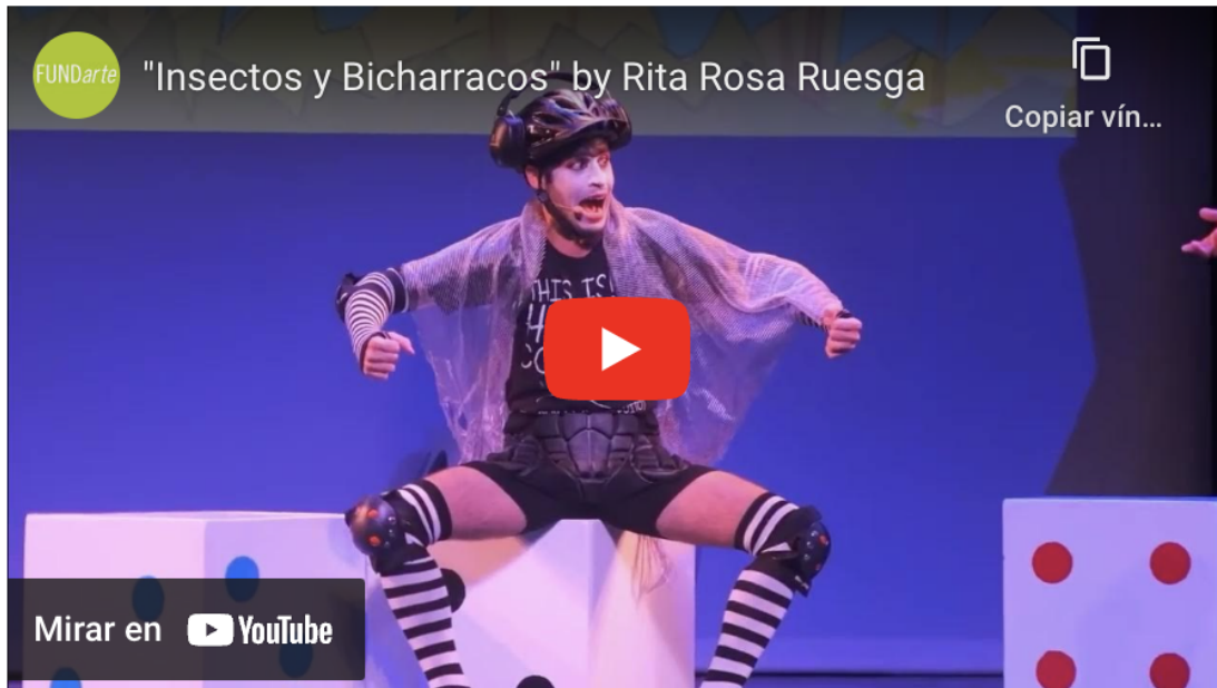
Video promocional de "Insectos y Bicharracos" para ZunZún Children`s Fest 2023.

Por su parte, el concierto de Luis Pescetti forma parte del Festival y del Programa Miami Beach Arts In the Park.